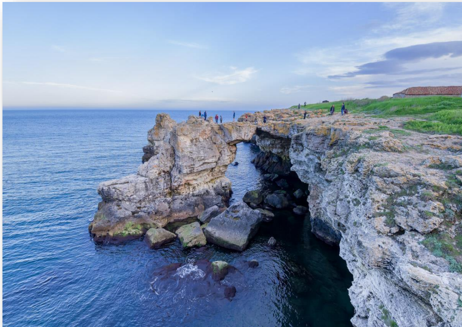
Арката на Тюленово